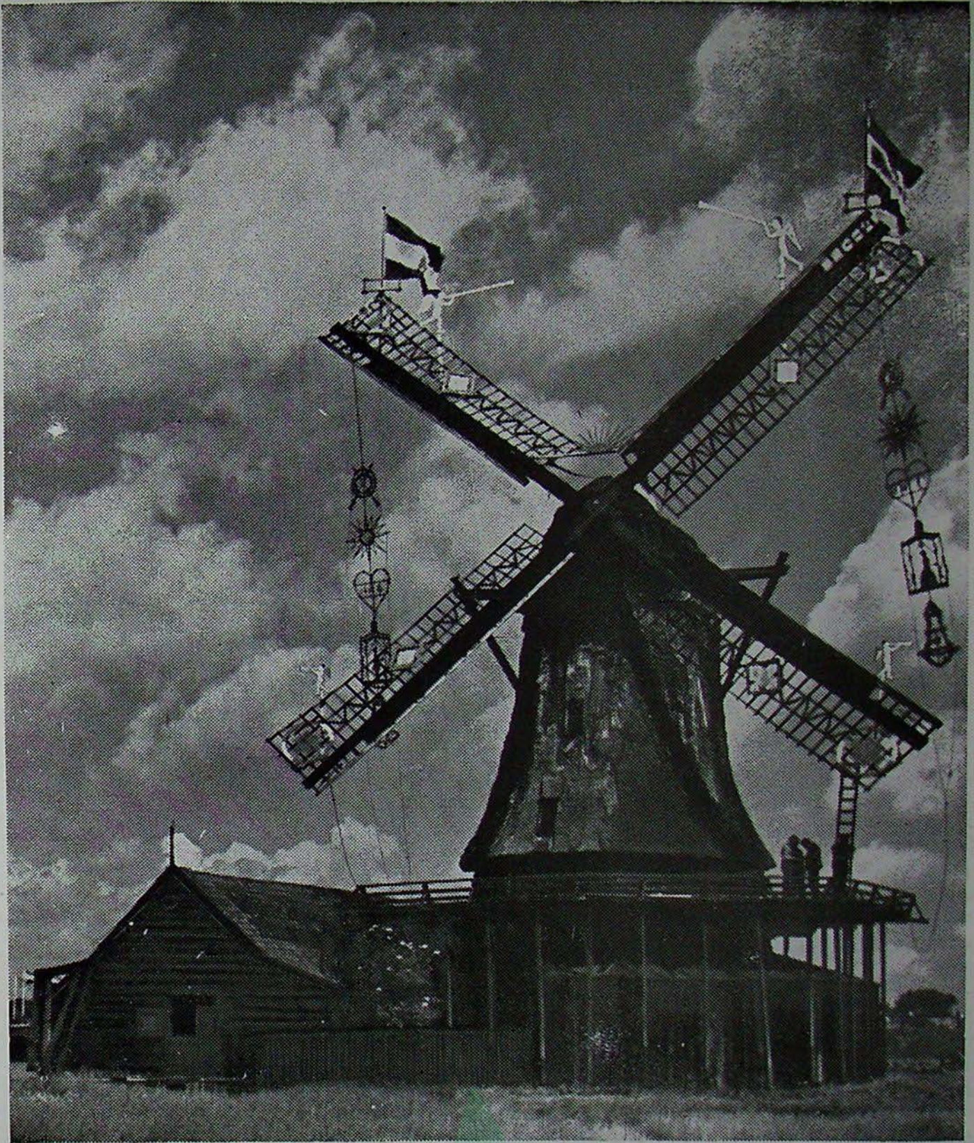
Reeds vroeg in den ochtend was de Zaanstreek gereed om Prinses Juliana, die te Zaandijk, een nieuwe brug opende, te ontvangen. Overal vlagden de molens, de fabrieksschoorsteenen, de huizen. Hoog en laag wapperde het rood-wit-blauw en Oranje, afgewisseld door het frissche groen van guirlandes. De Zaanstreek toonde zich op haar best. — De molen „De Ooievaar” in de onmiddellijke nabijheid van de nieuwe brug in feesttooi.