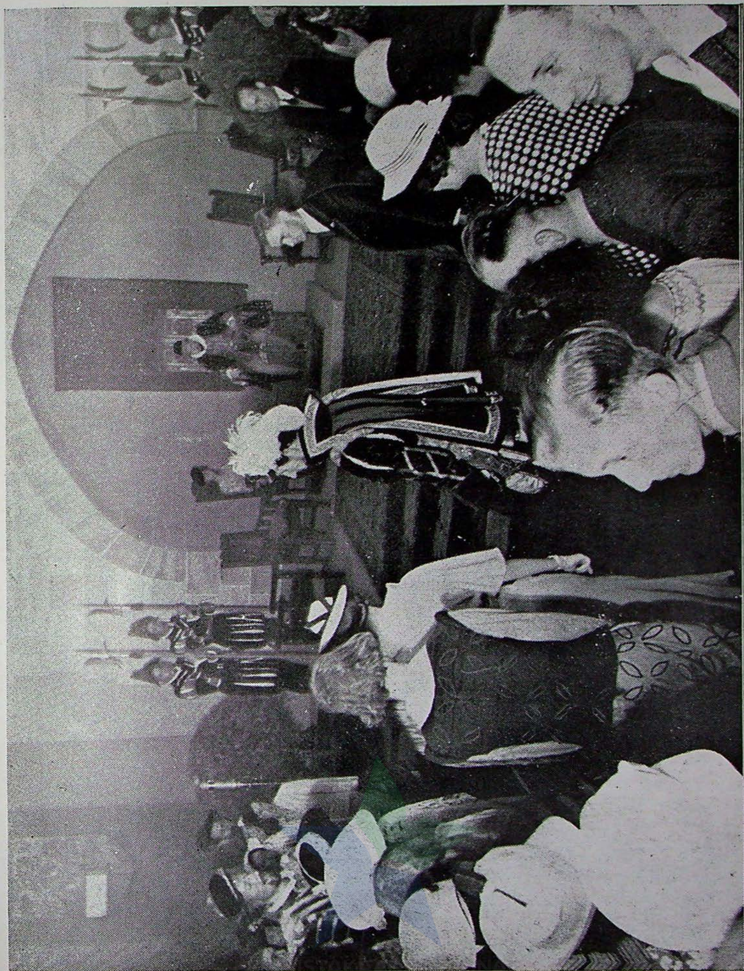
Ter gelegenheid van het 300-jarig bestaan van de Universiteit te Utrecht, heeft „Prins Willem van Oranje” een open receptie in de Jaarbeurszaal gehouden.