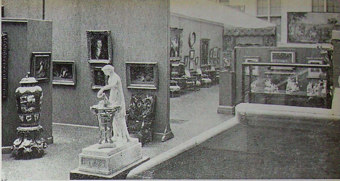
Een hoek v/d Expositie van Oude Kunst te Amsterdam.

het donker — men reisde meestal 's nachts om de ergste hitte te ontgaan — de laatste wagens van de karavaan of een paar paarden verdwenen. Europeesche reizigers namen dan ook een convoer van ruiters mee, al waren die soms banger voor de dieven dan de kooplieden, die zij moesten beschermen, zelf. Durfden de roovers een groot gezelschap niet aanvallen dan kwam het nog wel voor, dat zij een schatting oplegden vóór men mocht passeeren. Zij gaven dan voor, dat dit de tol was die men in vele dorpen moest betalen voor het doortrekken. Om niet noodeloos menschenlevens en goederen aan gevaar bloot te stellen betaalde men het gevraagde dan maar. Als wraak noemde men den roover dan in het dagboek „een jongen melckmuyl, die niet een haar om smoel en qualijk iets tot cledingh aan 't lichaam hadde”. Het deed het hart goed wanneer men zoo nu en dan eenige van de grijpvogels aan een boom „te drogen” zag hangen en men noteerde, dat het weer „de begeerlijkheit was, waarmede voorschreven quanten (tegen alle redelijckheit) geruymen tijt swanger geweest waren, die hun tot die feesthoudingh genodight hadde”. Dergelijke gelegenheden behoren tot de weinige, die den dagboekschrijver tot grappen verlokten.