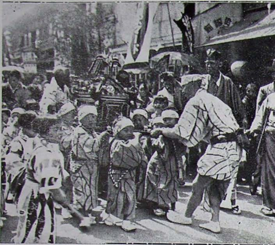
JAPANSCH KLEUTERS VIJREN FEEST ter eere van de komst van Gen zomer en in een kleurigen stoet treken zij door de straten van Tokio naar hun eigen tempel, waar eerst het plechtige gedeelte van het feest plaats vindt.

lang politiek caricaturist. Na twee jaren vergeefsche pogingen om tot een doelmatige samenwerking te komen diende hij zijn ontslag in. Dat neemt niet weg, dat hij (zoals hij in een lang interview mededeelde) toch in staat is geweest $ 600 000.000 van het Congres los te krijgen voor den aankoop van terreinen voor vogelreservaten en reservaten voor trogdieren. Hij denkt nu buiten de politieke sfeer van Washington aan het werk te trekken en te redden wat er nog te redden valt. Hij heeft een harde leerschool doorgemaakt en is hoewel zelf volbloed natuurbeschermer, tot concessies overgegaan. Hij doet water in zijn wijn om praktische resultaten te bereiken. Want met sentimentele betoogen van broodkruimelsstrooiende dames, die weinig invloed hebben, maar wat erger is, zich geen groote financieele offers willen getroosten,