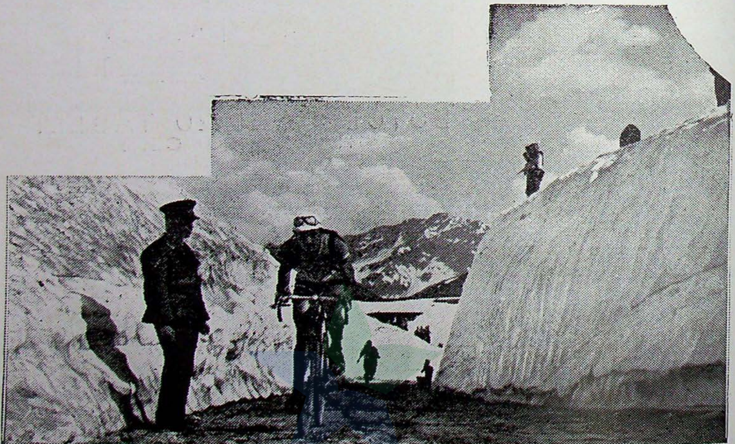
De deelnemers aan de „Ronde van Zwitserland” moesten i/d 3e etappe (Lugano-Luzern) den St. Gotthard pas overtrekken.

Vrijdag 7 Aug.: Pistoolschieten (Wannsee), degenschermen (Tennisbaan); 9.30 uur: Zeilen (Kiel); 10 uur: Tienkamp 100 M. (O. S.); 11.30 uur tienkamp verspringen (O. S.); 14 uur: Polo (Poloveld); 15 uur: tienkamp kogelstooten, 400 M. (O. S.); 15.15: 5000 M. beslissing (O.S.); 16 uur: tienkamp hoogspringen (O. S.); 17.30 uur: 400 M. beslissing (O. S.); 17.45 uur: tienkamp 400 M. (O. S.); 18 uur: Tsjechische turndemonstratie (O. S.); 15 uur: Degenschermen voor ploegen (Tennisbaan), pistoolschieten (Wannsee); handbal (Berlijnsche velden); 16 uur: hockey (H.S.); Kajaks voor 2 personen 10.000 M. (Grünau) 16.50 uur: vouwbooten twee personen 10.000 M. (Grünau); 17.10 uur: eenpersoons kajaks 10.000 M. (Grünau); 17.30 uur eenpersoons