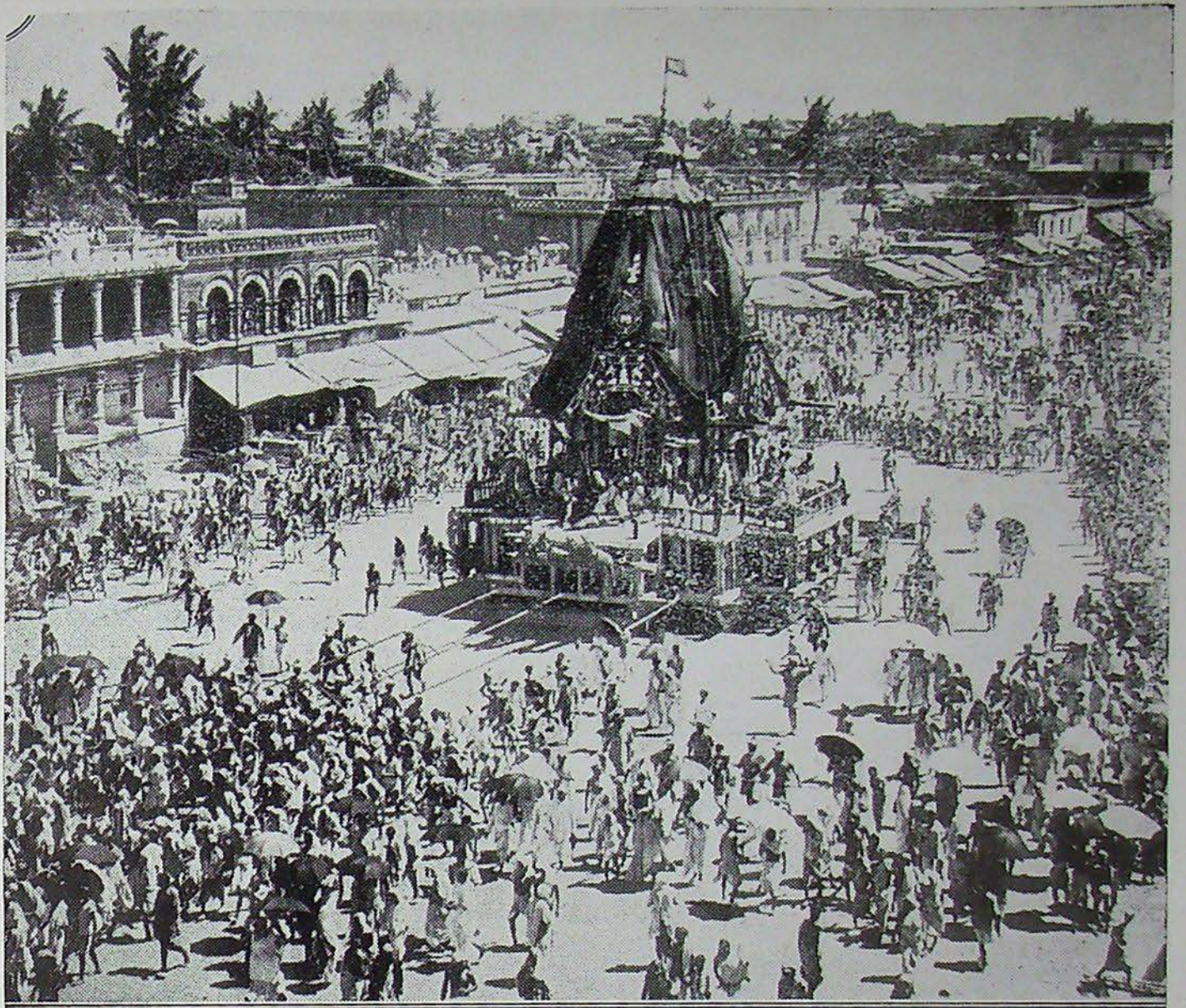
EEN FEEST VAN ONGEKENDEN LUISTER is het religieuze Raċna-Jatra-feest, dat eens per jaar te Puri in Britsch-Indië wordt gevierd. Drie afgodsbeelden uit den tempel van Joggernauth worden in een processie rondgereden en tienduizenden pelgrims uit het heele land verdringen zich om de beelden even aan te kunnen raken. Vijftig personen werden ditmaal in het gedrang gewond. — Een der wagens wordt door pelgrim door de straten getrokken.

„roep”, en vandaar „afstand waarover men een roep kan hooren”. Dat geeft ons een kijkje op de manier, waarop in overouden tijd in Indië de afstanden bepaald werden. In tegenstelling met „een steenworp ver” of „een uur gaans” is hier het geluid als maatstaf genomen. Dat men daarmee nog verschillen kan aangeven blijkt uit afstandsmaten, die men